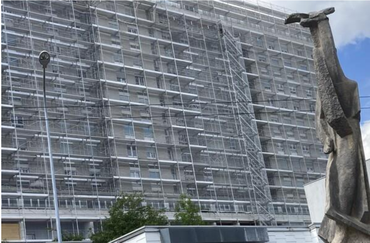
La face sud du Building. Au premier plan, la statue de la Fontaine du Tricentenaire.

Le Building accuse son âge et son statut de « bâtiment remarquable » ne facilite pas forcément la vie des propriétaires. S'il n'est pas placé sous protection cantonale, la note 2, dans l'appréciation du patrimoine architectural, en fait un immeuble d'un intérêt régional évident. Et cela implique quelques contraintes comme l'interdiction de démolir. Il est aussi impossible d'emballer le Building dans une seconde peau, à l'image du bâtiment voisin de Bois-Noir 25 à 37, construit dans la foulée en 1956, aujourd'hui propriété de la Caisse de pensions de l'État. Les autorités communales sont très vigilantes depuis que la Ville est inscrite au Patrimoine mondial de l'Unesco.