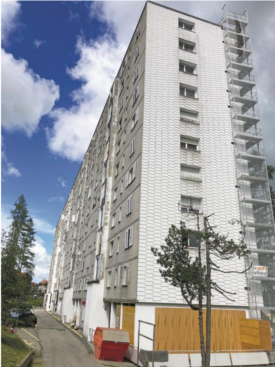
Le bâtiment est dans l'attente d'une autorisation de construire