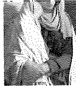
Jean-Bernard Vuillème La Mort en gondole